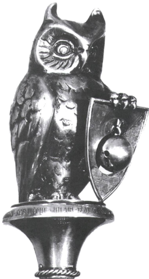
Die Eule: das Zunftsymbol auf dem Zunftmeister-Zepter

STRIX FLAMMEA HILARII, der Schleiereule nachgebildet, aber mit löffelartigen Ohren, «so hinweyset uff klugbeyt unnd fuersicht, wysbeyt und wachsamkeyt alls in der Zunft by tag und sunderlich in nachtzyt soellent gellten». Früh wurde die Farbe Gelb als Zunftfarbe gewählt, die Farbe der Bürgerlichen und des Freisinns. Unabhängig im Denken, frei in der Rede – das sollte auch in der Hilari-Zunft gelten. Das Wappen ist zweigeteilt, gelb und schwarz, und symbolisiert wohl die Tatsache, dass auch konservative, also schwarze Parteigänger, bald Mitglied in der Hilari-Zunft wurden. Die vorhandenen Protokolle schweigen sich dazu aus, doch die beiden Farben haben sich, obwohl die Parteifarben der Zünfter heute bunter sein dürften, über die hundert Jahre als Zunftfarben gehalten.