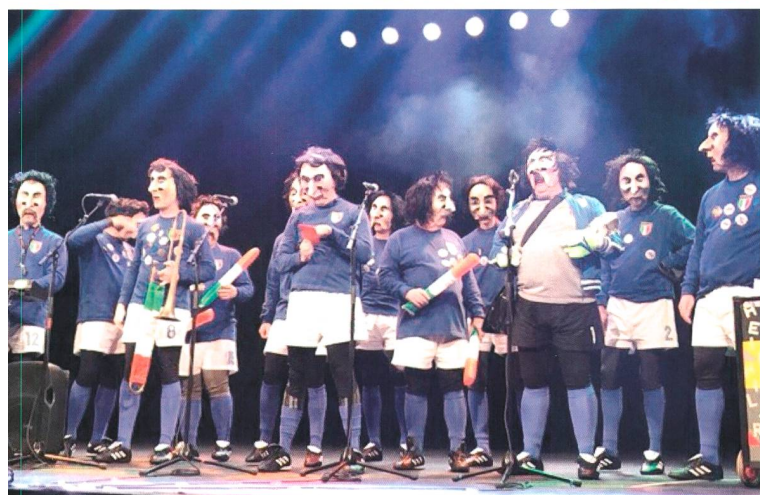
Oben: «The Bus Brothers»: Auftritt des Hilari-Wagenbaus am Fasnachtsumzug 2014 Mitte: Auftritt der Clique: «Savoir Hilari», 2012 Unten: «Squadra di Hilari», Fasnacht 2018

hause oder in ihren Krippen, erzählen eine Weihnachtsgeschichte, lauschen den Versen und Liedern der Kinder und verteilen die feinen Hilari-Chlausensäckli. Die Säckli werden jeweils in grosser Arbeit von den Zunftschwestern und dem «Chlausenschryber» vorbereitet. Mitte Januar, am Samstag kurz vor oder nach dem St.