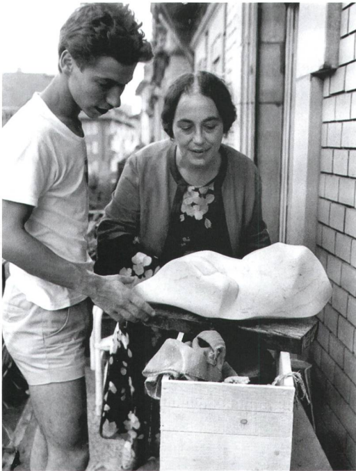
Auslieferung der ersten Skulptur in Bern, 1983

So kam es, dass er sich zwar mit dieser Plastizität in der Kunst befasste, aber unter der Bedingung, dass seine