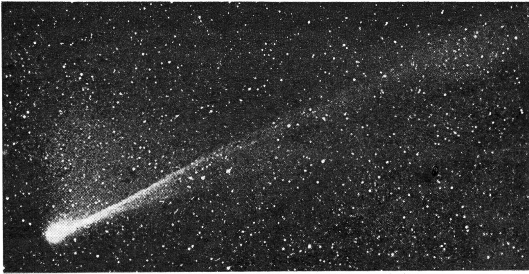
Komet Honda-Bernasconi (1948 g)

schöne Wetter ermöglichte fortlaufende Beobachtung bis zum 15. Juni, soweit nicht berufliche Pflichten solche verhinderten. Die Helligkeit, die vom Entdecker als 4. Grösse angegeben wurde, nahm langsam ab und betrug am 15. Juni 23 h W. Z. noch 5 m ,9.