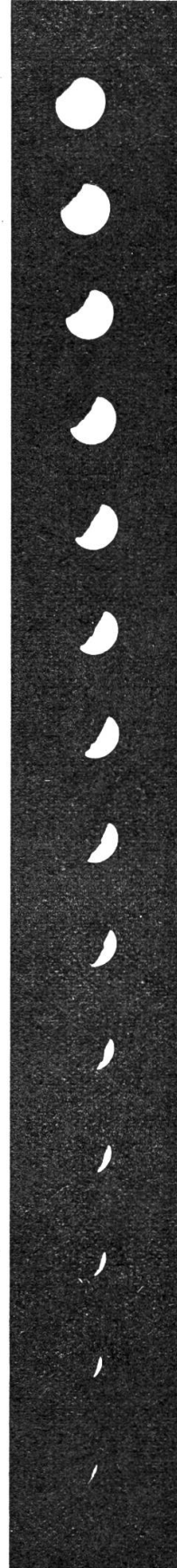
Serie der abnehmenden Phasen