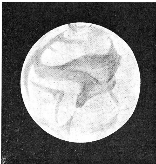
Zeichnung von R. Compte Porta, Palma de Mallorca, vom 30. Aug. 1956, um 23 h 30 m . Arcographische Länge \omega = 26^\circ , Refraktor 70 mm und Spiegelteleskop 110 mm Oeffnung, Vergr. 150- und 200-fach. Dunkelgebiet des Margaritifer Sinus und Mare Erythraeum, links Sinus Sabaeus.

Es werden naturgemäss noch einige Jahre ausdauernder Arbeit verstreichen, bevor das höchst umfangreiche und wertvolle zeichnerische, photographische und anderweitig gewonnene Beobachtungsmaterial, das während der äusserst günstigen Mars-Opposition von 1956 in der ganzen Welt gesammelt wurde, vollständig verarbeitet sein wird und neue Schlussfolgerungen zulässt, die von allen astronomisch interessierten Kreisen mit Spannung erwartet werden.