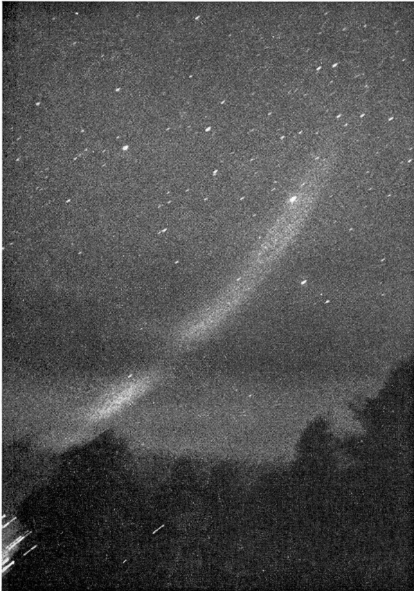
Fig. 1: Photographie de la comète Ikeya-Seki par M. KELLER Date: 31 octobre 1965 05 h 20 min. Objectif 1/2,8, 50 mm Temps de pose: 6 min. Station de Montfleury.

La tabella seguente contiene gli elementi dell'orbita delle comete.