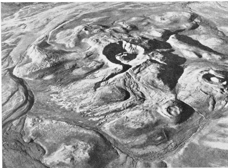
Pingos à différents stades. Cliché d'avion par E. HOFER. - Expédition du Dr LAUGE- KOCH, d'après H. et G. TER- MIER: «Erosion et Sédimenta- tion», Masson et Cie, 1960.

Il n'existe aucune raison de refuser à la Lune l'existence d'un gradient thermique croissant vers la profondeur, comme il est de règle dans l'écorce terrestre, et la radioactivité récemment mesurée de la Lune y démontre l'existence d'une source de chaleur interne. Ainsi, à une profondeur que rien pour le moment ne nous permet de préciser, la température du sous-sol lunaire peut être telle qu'on parvient à des