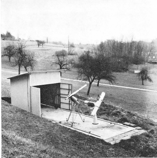
Abb. 2: Gesamtansicht der Beobachtungsstation auf dem Gempen-Plateau (Gemeinde Seewen SO).

L'observatoire du plateau de Gempen (Soleure) avec l'abri glissant sur deux rails en tubes d'acier et tôle ondulée.