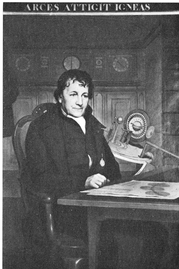
Bildnis von EISE EISINGA (1744–1828) durch WILLEM BARTEL v. D. KOOL.

ren und Saturn in 29.46 Jahren. Die drei Planeten: Uranus, Neptun und Pluto waren ja zu der Zeit, als EISINGA an seinem Planetarium arbeitete, noch nicht entdeckt. Uranus wurde allerdings noch zu seinen Lebzeiten gefunden, nämlich im Jahre 1781.