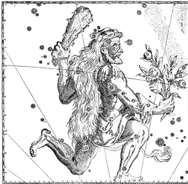
Herkules nach BAYER, 1603 (FLAMMARION, Fig. 154)

Sechzig Jahre später hat HEVELIUS den Zweig durch Schlangen ersetzt, welchen er den Namen Cerberus, Hüter der Hölle, gegeben hat (dem Höllenhund mit vielen Köpfen wachsen nach der Sage auch Schlangen aus dem Leib), und auf den Herkules anscheinend mit seiner Keule schlagen will, wahrscheinlich mit der Absicht, ihn zu betäuben (Figur 155).