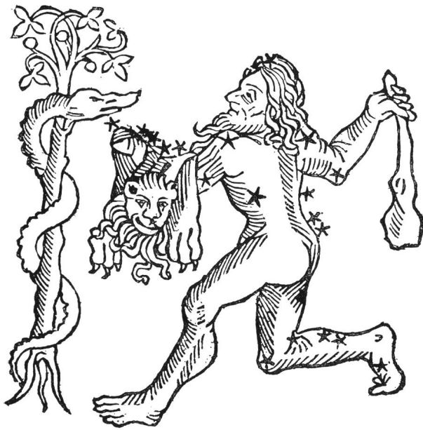
Herkules nach HYGINUS, 1485 (FLAMMARION, Fig. 153)

(153), die wir hier wiedergeben, den Herkules, wie er auf dem linken Arm das Fell des Nemeischen Löwen trägt und im Begriffe ist, mit seiner Keule die Schlange zu erschlagen, die den Baum mit den goldenen Früchten behütet.