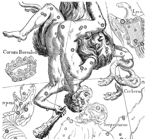
Herkules nach HEVELIUS, 1660 (FLAMMARION, Fig. 155)

Alle: EUDOXUS, ARATUS, ERATOSTHENES, HIPPARCHOS, PTOLEMAEUS und andere nennen ihn den Knienden. Ich finde zum ersten Mal und zu meinem grossen Erstaunen den Namen Herkules in der Ausgabe des HYGINUS, von der ich vorher gesprochen habe (1485), und noch ist er hier mit dem anderen Namen «Engonasi, Herkules» verbunden. Im Katalog von TYCHO BRAHE (1590) trägt diese Figur gleichfalls die beiden Namen. Der Name Herkules ist also eine verhältnismässig moderne Benennung.