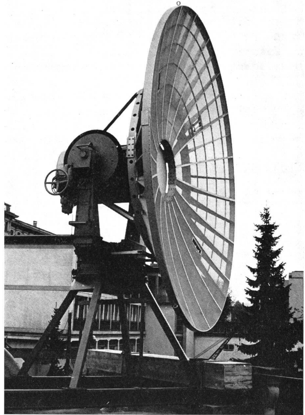
Parabolreflektor des ETH-Radioteleskops ohne Primärstrahler.

Adresse des Verfassers: Dipl. Ing. H. K. ASPER, Plattenstrasse 98, 8706 Meilen.