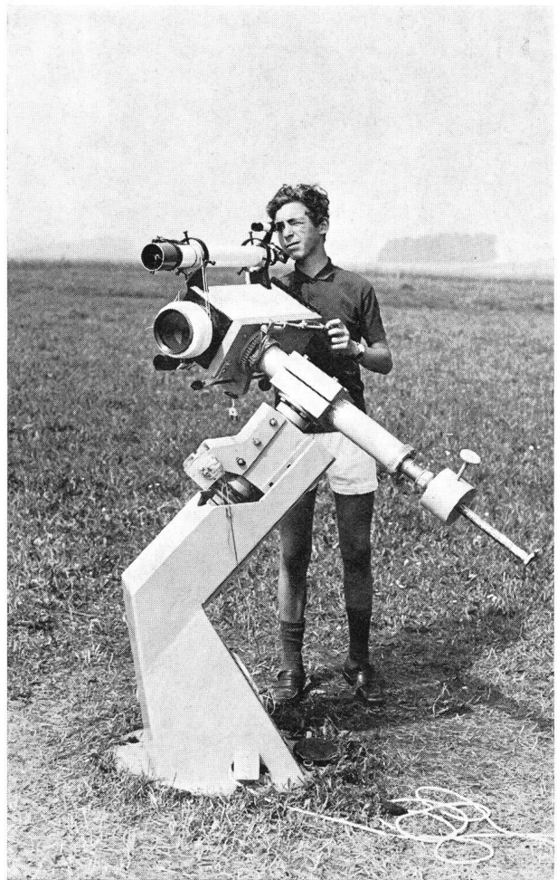
50mm-Astrograph mit Knicksäulenmontierung.

Eine willkommene Abwechslung brachte der Tagesausflug zu den Observatorien Hoher List und Efelsberg. Das derzeit grösste frei schwenkbare Radioteleskop, das 100m-Teleskop des Max-Planck-Instituts für Radioastronomie (Bonn), beeindruckte sicher alle Teilnehmer.