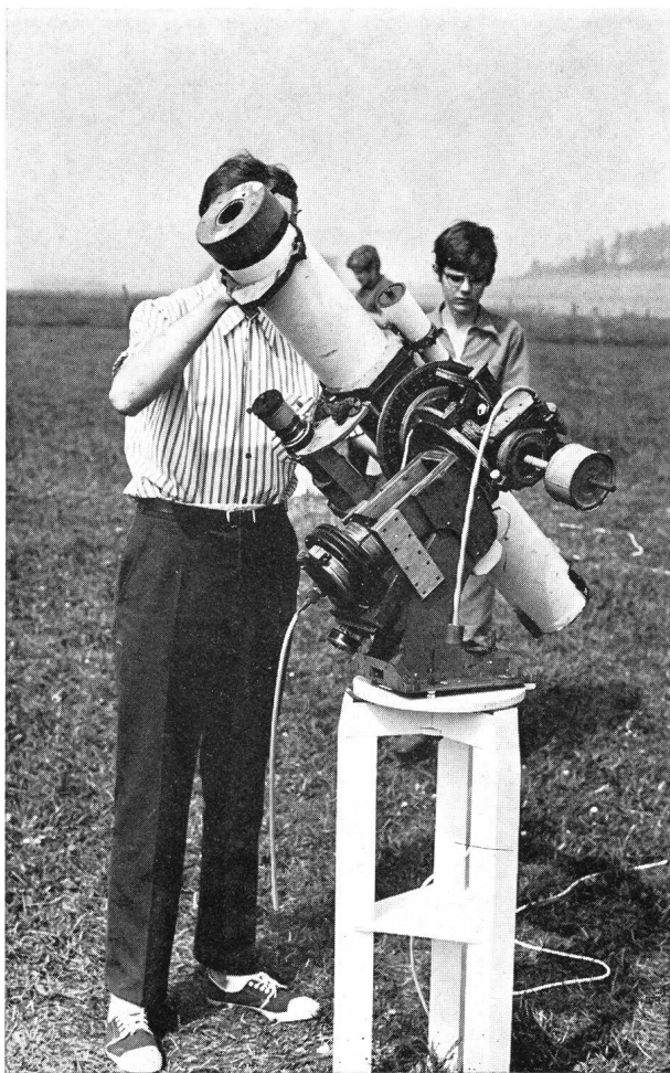
110mm-Newton-Teleskop mit Nachführung. Fast alle Teile sind aus Holz; der Bau des Fernrohres dauerte ca. ein Jahr.

Bei klarem Wetter wurde das Abendprogramm früher abgebrochen, um die ohnehin sehr geringe Beobachtungszeit voll ausnützen zu können. Da der Himmel nur zwei- bis dreimal richtig klar war, wurde dann meist bis zum Morgen durchbeobachtet und fotografiert. Zur Beobachtung standen einige von den Teilnehmern selbst mitgebrachte Instrumente zur Verfügung; das grösste ein 20cm-Reflektor.