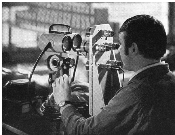
Bild 2: Justierung der mechanischen und optischen Elemente am Zielkopf des Infrarot-Distanzmessers Wild DI 10.

Als grösstes feinmechanisch-optisches Werk der Schweiz beschäftigt die Firma Wild heute mehr als 4000 Mitarbeiter, davon rund 3500 Personen im St.