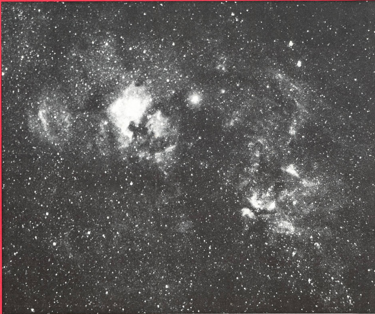
Milchstrasse im Schwan. Aufnahme von G. Klaus mit Zeiss-Sonnar 1:1,5 und Schott-Interferenzfilter auf Kodak 103a-E-Film. Belichtungszeit 30 Minuten. Weitere Stellaraufnahmen: In diesem Heft.

Zeitschrift der Schweizerischen Astronomischen Gesellschaft Bulletin de la Société Astronomique de Suisse