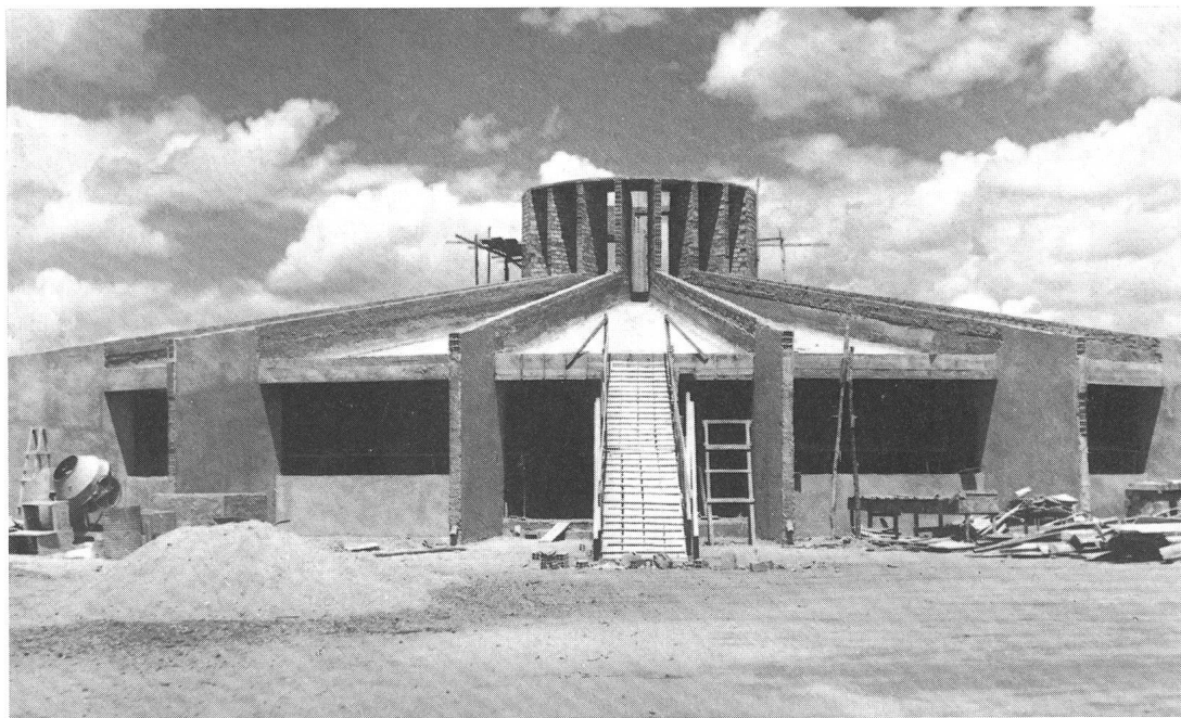
Fig. 1: Die im Bau befindliche Antares-Sternwarte in Feira de Santana.