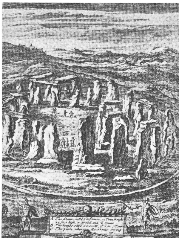
Treasures of Britain, London 1968, p. 10.