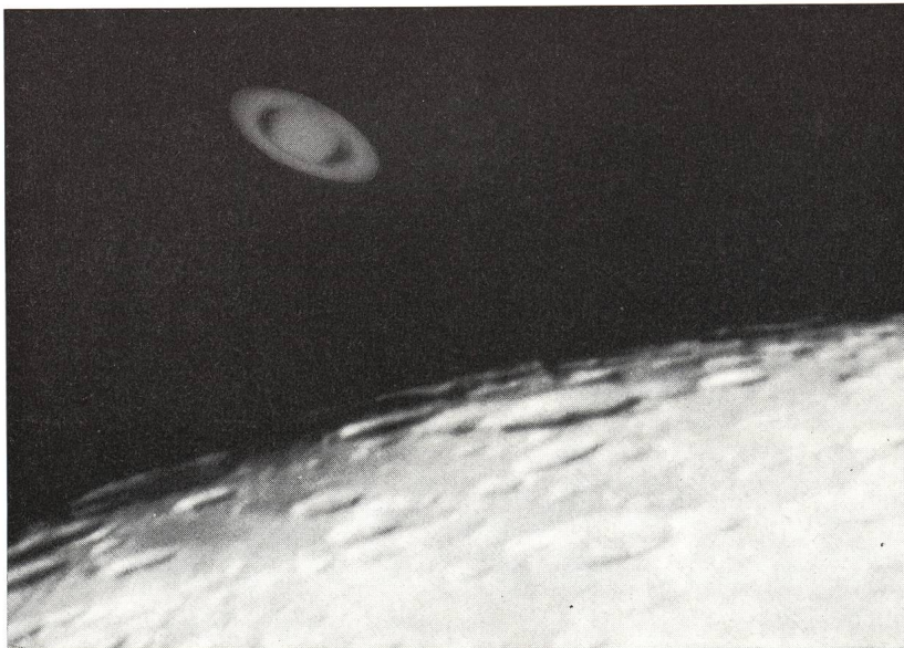
Der Ringplanet Saturn neben dem Erdmond.

planeten nahe dem Erdtrabanten im Bilde festzuhalten. Eine solche Aufnahme sandte uns Herr HANS BERNHARD aus München. Wir möchten sie unseren Lesern nicht vorenthalten!