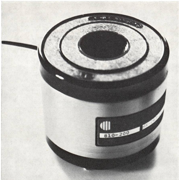
Abb. 1: Thermostat mit eingebautem Interferenzfilter. Masse: 89 mm Durchmesser, 75 mm Höhe. Einbau: mit 3 Schrauben an Grundplatte oder passender Wiege.

Im Protuberanzen-Instrument der Feriensternwarte Carona und im Instrument von Herrn G. KLAUS, Grenchen, konnte ein derartiges Filter erprobt werden. Der Einbau erfolgte in den Strahlengang der sekundären Optik anstelle des Filters von 4,5 \text{ \AA} . Das neue Filter verlangt eine sorgfältig konstant gehaltene Arbeitstemperatur. Es ist daher fest in einen Thermostaten eingebaut (Abb. 1). Abhängig von der Aussentemperatur wird nach Inbetriebnahme die Arbeitstemperatur von ca. 58^\circ\text{C} in 3–8 Minuten erreicht. Die Konzeption der elektrischen Temperatursteuerung ist modern und schliesst Störungen praktisch aus. Neuartige Sensoren halten die Temperatur auf Bruchteile eines Grades konstant. Bei einer Spannung von 220 V AC nimmt der Thermostat einen Strom von ca. 85 mA auf. Die Durchmesser der ein-