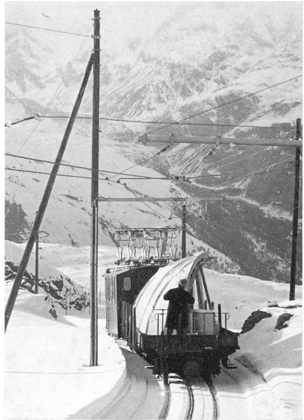
Coupole quittant le Gornergrat pour Vevey.

La Société d'Astronomie de La Tour-de-Peilz vient de bénéficier d'un don d'une valeur exceptionnelle: En effet, la Fondation «Hochalpine Forschungsstation Jungfraujoch + Gornergrat» lui a remis une coupole d'acier de 4,8 m de diamètre ainsi que l'excellente monture équatoriale qui l'équipait. La coupole garnissait l'une des tours de l'hôtel du Gornergrat et va être remplacée par une construction plus importante. La monture, construite au début de ce siècle, a été constamment modernisée, elle est apte à recevoir sans problèmes un instrument de 40 cm. La clause fixée par la Fondation est que ces matériels soient réinstallés d'ici une année environ et servent entre autre à l'information du public et, spécialement, de la jeunesse.