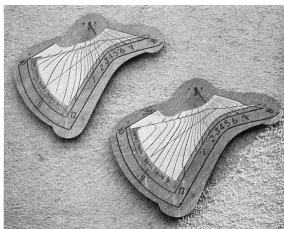
Abb. 1: Zifferblatt-Paar einer Sonnenuhr für MEZ an einer nach SW gerichteten Hausfassade an der Toggenburger Hauptstrasse in Neu St. Johann. Die Zifferblätter bestehen aus zwei Eternitplatten, in welche die Zeitlinien eingeschliffen wurden.

Entsprechend dem Verlauf der Zeitgleichung ist auch jener des Schatten- oder Lichtwurfs für die «Halbjahre» Dezember bis Juni und Juni bis Dezember verschieden. Man kann diesem Umstand dadurch Rechnung tragen, dass man für diese Zeitabschnitte zwei verschiedene Zifferblätter verwendet, vergl.