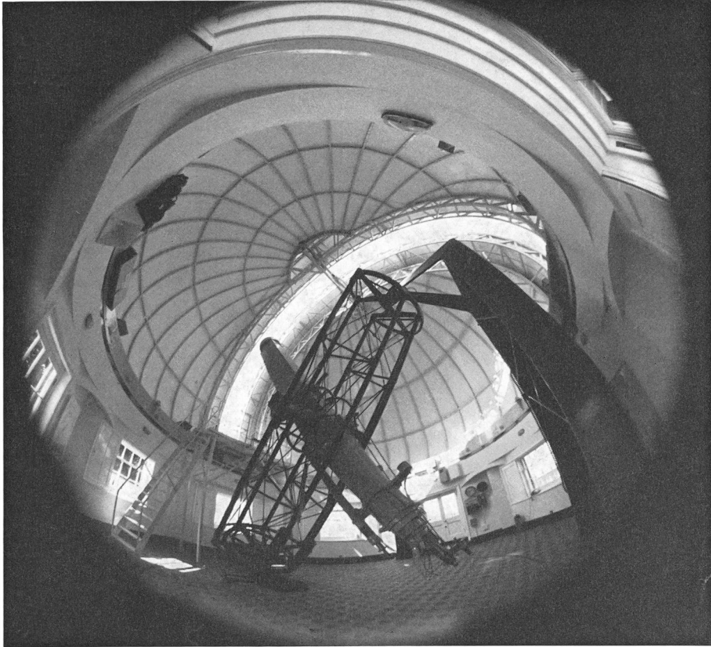
Bild 3: Das im Observatorium unter der neuen Kuppel aufgestellte, aus dem Jahr 1895 stammende 711 mm-Teleskop.

zeitig ist sie heute eines der grossartigsten astronomischen Museen, das Jahr für Jahr von zahlreichen Interessenten besucht wird und einen einzigartigen Überblick über astronomische Leistungen in den letzten drei Jahrhunderten gibt (vgl. Bild 1).