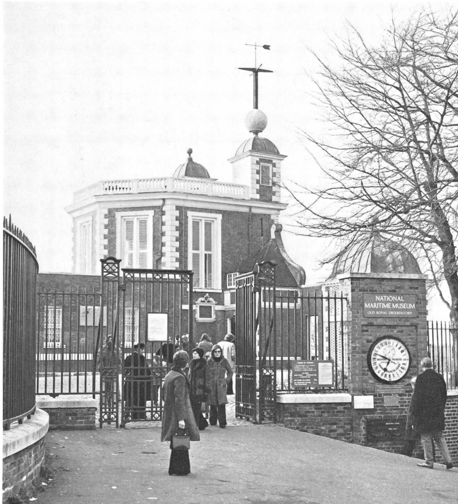
Bild 1: Eingang zur Sternwarte und dem astronomischen Museum von Greenwich. Rechts vorne die Uhr, die Greenwich Mean Time anzeigt.

Die Ableitung der Längengrade von aus Mondbeobachtungen gewonnenen Daten war ziemlich kompliziert. Viel einfacher war es im Prinzip, die geographische Länge eines Ortes anhand des Unterschieds zwischen der dortigen Zeit und der Ortszeit eines festen Bezugspunkts, wie Greenwich, zu bestimmen. Dafür aber hätten die Schiffe eine auf die Greenwich-Zeit eingestellte genau gehende mechanische Uhr mitführen müssen, so dass aus dem Vergleich zwischen der von ihr angezeigten und der an anderen Orten der Erde auf Grund des Sonnenstandes registrierten Uhrzeit deren Längengrad hätte errechnet werden können. Doch unglücklicherweise gab es damals keine Uhren, die bei Seegang und unter wechselnden klimatischen Bedingungen genau gingen.