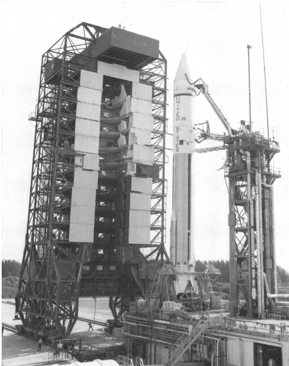
Abb. 2: Ein weiterer moderner Nachrichtensatellit (Intelsat IV) wurde mit einer Atlas-Centaur-Rakete am 11. Mai 1975 auf seine Position über Indien gebracht. Dieses Bild zeigt ihn auf der Rakete kurz vor dem Start auf Cape Canaveral.

Heute, nach knapp 15 Jahren, sind die neuen ATS-Weltraumsatelliten, etwa ein Dutzend, im Einsatz. Sie sind alle in etwa 37000 km Höhe stationiert, bleiben also am Himmel an derselben Stelle, da sie mit der Erde synchron in 24 Stunden einen Umlauf machen. Zwei von ihnen übermitteln täglich Unterricht in den abgelegenen Gebieten in den Rocky Mountains und in Alaska und helfen den einsamen Ärzten