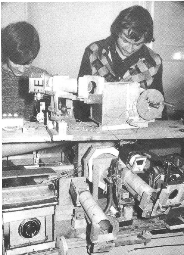
Abb. 1: Die beiden Erbauer des Planetariums hinter dem Gerät. Von hier aus wird die ganze Anlage gesteuert und auf eine Leinwand von 5 \times 3,2 m projiziert.

Sicher ist allen Mitgliedern der SAG das Planetarium im Verkehrshaus der Schweiz in Luzern bekannt, das im Sommer 1969 eingeweiht wurde und seither schon Tausende von Besuchern in seinen Bann zog. Eine