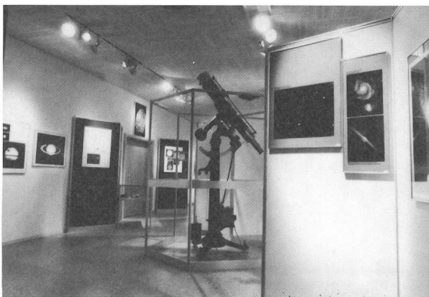
Abb. 2: Blick in die Astrofotoausstellung «Faszinierendes Universum». Im Zentrum der Ausstellung der grosse Rheinfelder und Hertel-Refraktor (Besitzer der R. A. Naef-Stiftung).