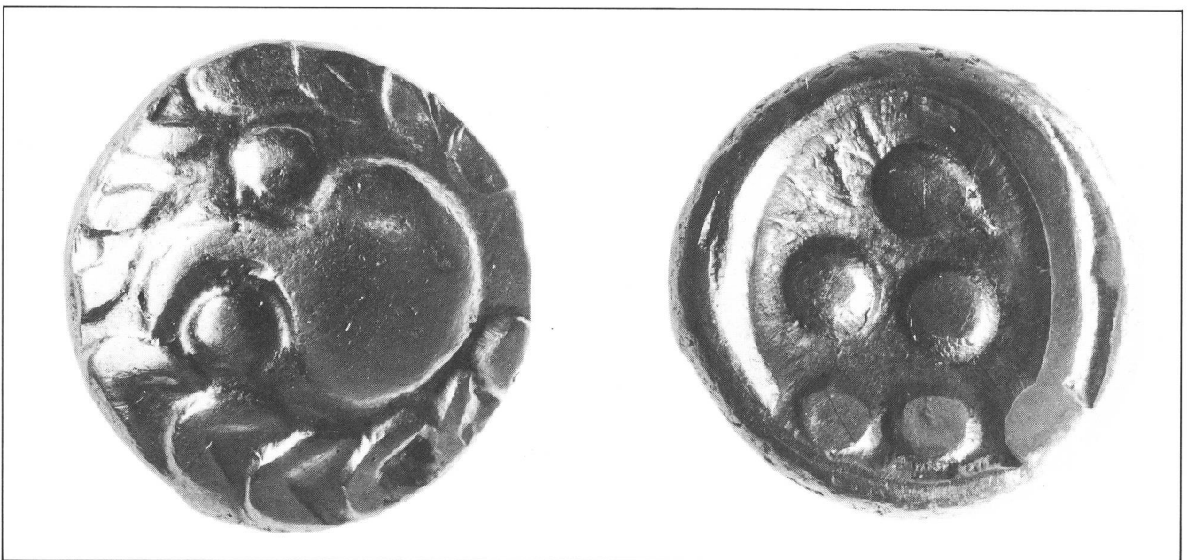
Abb. 1: links, Vorderseite eines keltischen Goldstaters, eines sogenannten «Regenbogenschüsselchens». Durchmesser der Münze 17 mm, Gewicht ca. 7,5 Gramm; rechts, Rückseite der Münze.

Von grosser Bedeutung ist die Zahl zwölf . Wir finden sie, wenn wir die Mondsicheln auf unserer Münze zählen. Hier sind offensichtlich die zwölf Lunationen des Jahres gemeint. Als letzte ist die Zahl fünf im Münzbild enthalten (Bild 2c). Ihre Deutung folgt im nächsten Abschnitt.