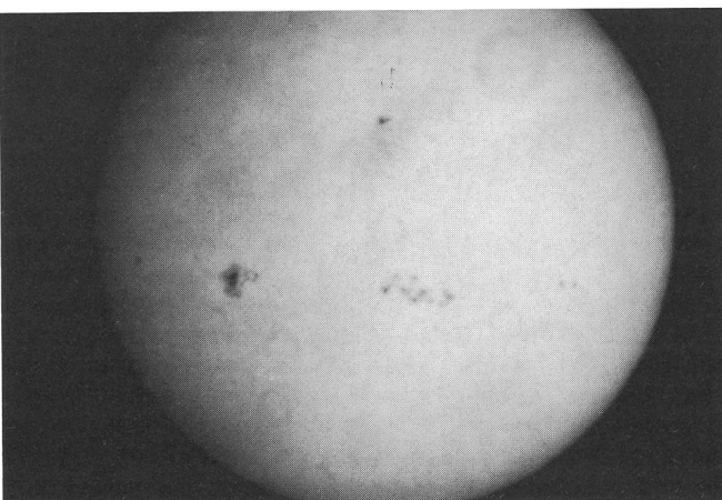
Sonnenflecken vom 19.6.1982

noch besser! Nun, wer möchte noch bei der Ergänzung mit dabei sein?