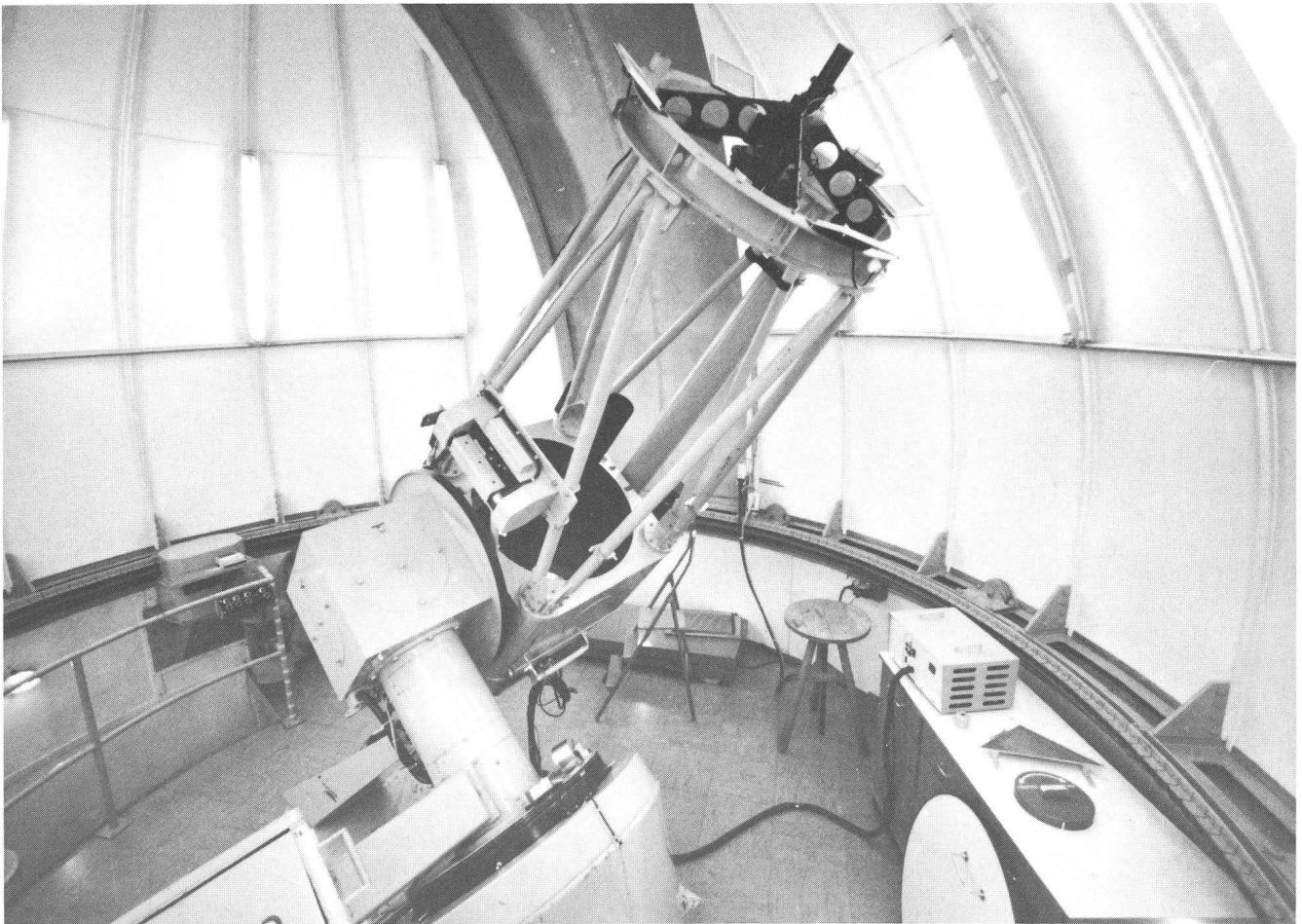
Le télescope de 76 cm du Jungfrauoch.

Les recherches entreprises dans le cadre de la fondation du Jungfrauoch-Gornergrat, sans que les autres disciplines ne soient pour autant négligées, se sont donc de plus en plus orientées vers l'astronomie. Ceci s'explique en grande partie par les qualités du ciel de haute altitude jointes à la facilité d'accès à des installations permanentes importantes. L'Observatoire du Sphinx se trouve en effet au-dessus d'un tiers de l'atmosphère terrestre. C'est ce tiers inférieur précisément qui contient en suspension la majeure partie (environ 95%) des poussières, ainsi qu'une grande part de la vapeur d'eau. Sous nos latitudes, un observateur placé au niveau de la mer voit au-dessus de lui l'équivalent d'une couche de 5 cm d'eau sous forme de vapeur. A 3600 m, cette quantité de vapeur d'eau précipitable n'atteint que quelques millimètres en moyenne par temps clair et, par temps exceptionnellement sec, peut se réduire à 0,25 mm. La vapeur d'eau présente de larges bandes d'absorption dans l'infrarouge; elle limite de manière dominante les observations astronomiques dans ce domaine spectral. La photométrie stellaire dans le domaine visible bénéficie grandement de la stabilité de la transparence, due à la pureté de l'atmosphère, ainsi que de la faible brillance du ciel nocturne qui améliore le rapport signal sur bruit des mesures. C'est ainsi que, même si les conditions climatiques ne sont pas optimales en nos régions, ces qualités de site compensent la faible fréquence de temps clair.