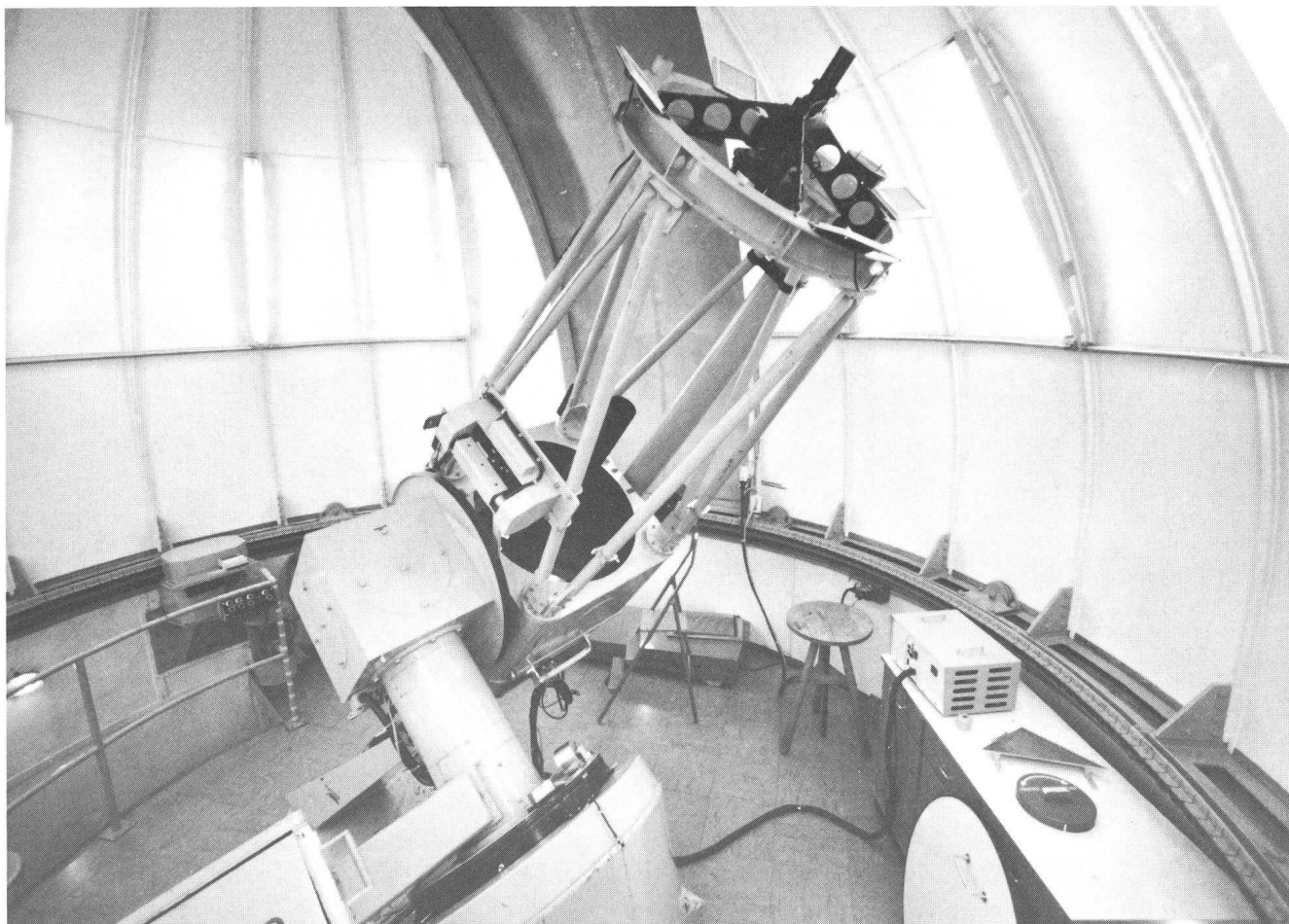
Le télescope de 76 cm du Jungfrauoch.

Les recherches entreprises dans le cadre de la fondation du Jungfrauoch-Gornergrat, sans que les autres disciplines ne soient pour autant négligées, se sont donc de plus en plus orientées vers l'astronomie. Ceci s'explique en grande partie par les qualités du ciel de haute altitude jointes à la facilité d'accès à des installations permanentes importantes. L'Observatoire du Sphinx se trouve en effet au-dessus d'un tiers de l'atmosphère terrestre. C'est ce tiers inférieur précisément qui contient en suspension la majeure partie (environ 95%) des poussières, ainsi qu'une grande part de la vapeur d'eau. Sous nos latitudes, un observateur placé au niveau de la mer voit au-dessus de lui l'équivalent d'une couche de 5 cm d'eau sous forme de vapeur. A 3600 m, cette quantité de vapeur d'eau précipitable n'atteint que quelques millimètres en moyenne par temps clair et, par temps exceptionnellement sec, peut se réduire à 0,25 mm. La vapeur d'eau présente de larges bandes d'absorption dans l'infrarouge; elle limite de manière dominante les observations astronomiques dans ce domaine spectral. La photométrie stellaire dans le domaine visible bénéficie grandement de la stabilité de la transparence, due à la pureté de l'atmosphère, ainsi que de la faible brillance du ciel nocturne qui améliore le rapport signal sur bruit des mesures. C'est ainsi que, même si les conditions climatiques ne sont pas optimales en nos régions, ces qualités de site compensent la faible fréquence de temps clair.