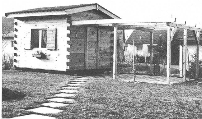
Blockhaus mit Pergola.

Zum Fotografieren benütze ich eine Minolta XG2, welche sich dank dem sehr hellen Sucherfeld gut bewährt. Das Auslösen der Kamera erfolgt elektrisch über ein Kabel, welches mit einem Kippschalter im Bedingungsgehäuse des Frequenzwandlers verbunden ist. Diese Anordnung hat sich als sehr komfortabel erwiesen, kann doch der Leitstern genau auf das Fadenkreuz gerichtet und die Kamera – ohne die Stellung des Auges zu verändern – mit einem Finger ausgelöst werden. In der Praxis hat sich herausgestellt, dass die Kapazität der in der Kamera eingebauten Knopfzellen für längere Belichtungszeiten nicht ausreicht. Dieser Mangel wurde durch die