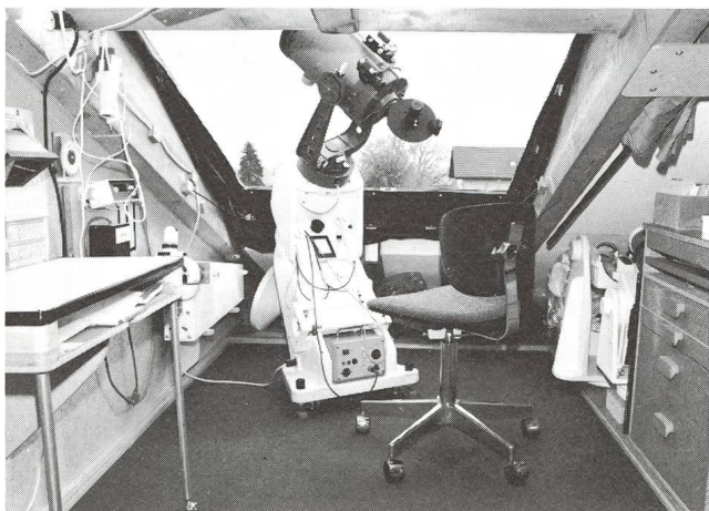
Innenansicht der Beobachtungsstation mit der selben Montierung. Ganz links im Bild ist ein dreibeiniger Rolltisch zu sehen, der unmittelbar an die Montierung für das Zeichnen am Okular herangezogen werden kann.

Die Umgebungstemperatur-Unterschiede sind für das «Seeing» wichtig. Es ist erstaunlich, wie schnell sich die Dach-