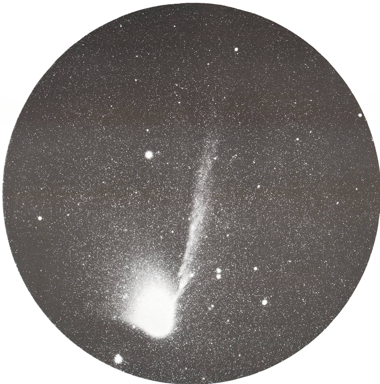
RA 14 h 25 m Dekl. -43° 10', 11. April 1986, 21.20—21.30 UT Farm Naos, Namibia, Film TP 2415 hyp.

gekommen bin. Mit dabei war natürlich wieder meine Celestron-Schmidt 20/20/30 cm, für die ich selber eine grössere Filmkassette gebaut habe, die ein Bildfeld von 10^\circ Durchmesser = 52 mm ausleuchtet. Dass das, und wie das funktioniert, sehen Sie an den beiden beiliegenden Vergrößerungen, die 4