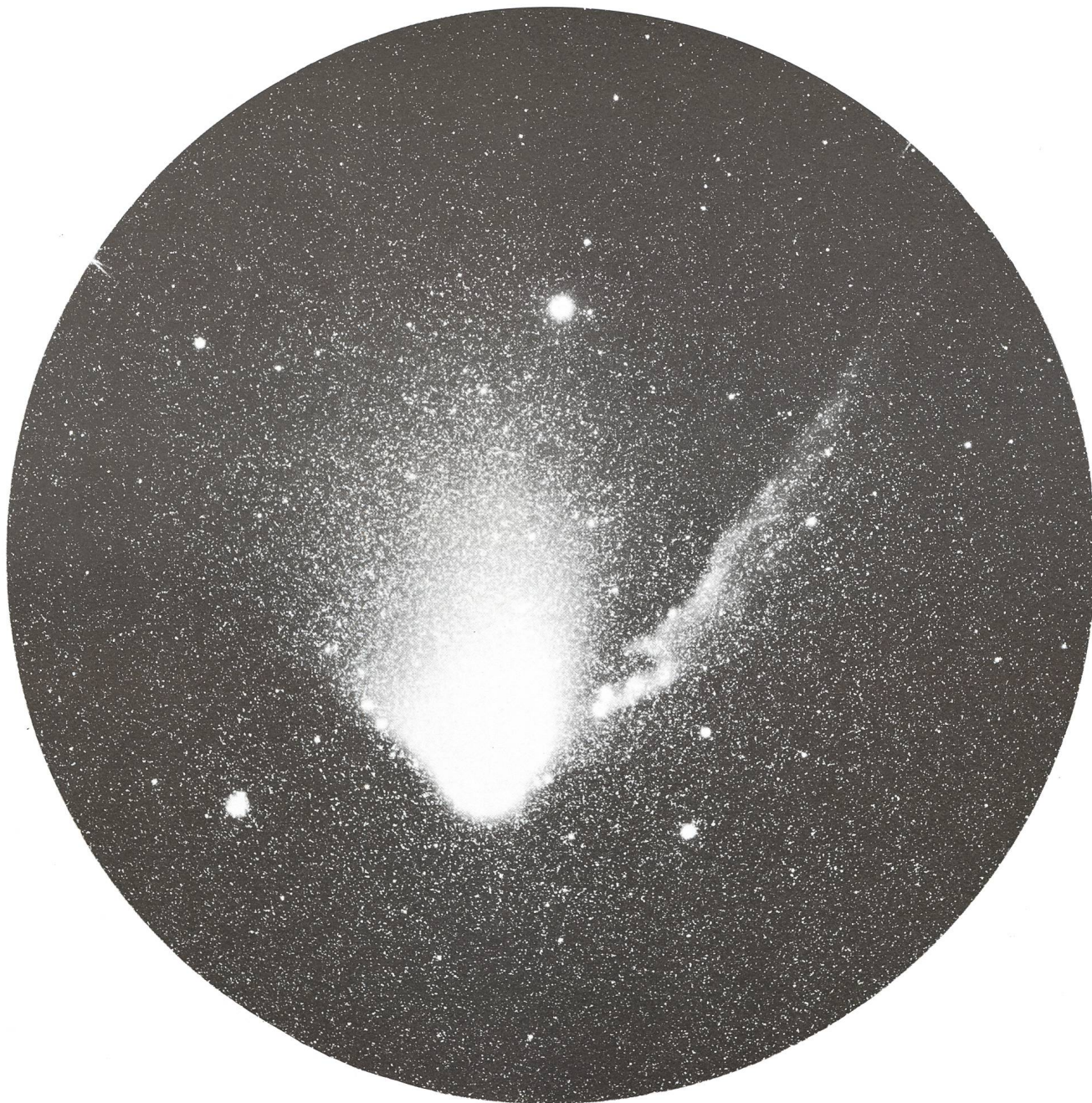
RA 14h 25 m Dekl. -43° 50', 12. April 1986, 02.10—02.20 UT Farm Naos, Namibia, Film TP 2415 hyp.

GERHART KLAUS, Waldegstrasse 10, CH-2540 Grenchen