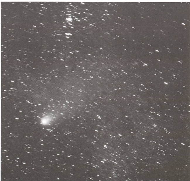
P. Halley, 1986, 6. April, 35 min. effektive Belichtungszeit von 04.10 Uhr bis 04.52 Uhr UT mit Unterbrechungen auf Ektachrome 200, entwickelt wie 400 ASA. Oben in der Bildmitte der offene Haufen NGC 6231.

THOMAS MÜLLER, 64, rue Rothschild, CH-1202 Genf.