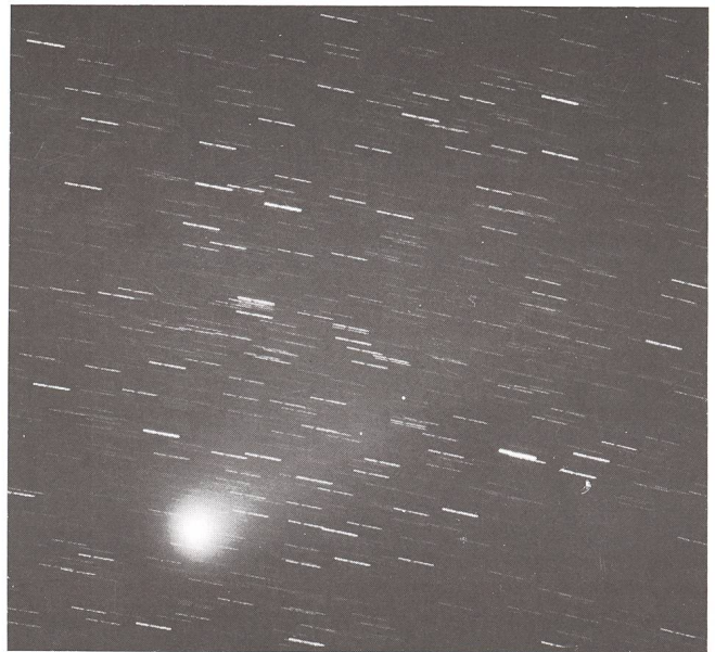
P. Halley, 1986, 7. April. 45 min auf 3M 1000 von 03.45 Uhr bis 04.30 Uhr UT.

En haut au centre, amas ouvert NGC 6231. 180 mm f:2,8. Las Cañadas, 2300 m d'altitude.