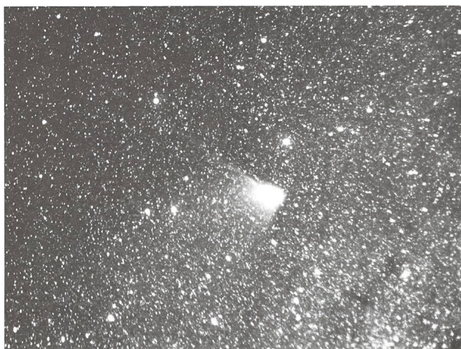
Halley dans la constellation du Loup, aux «confins» de la voie Lactée

Après une semaine passée au Chili, nous avons repris l'avion pour le Brésil où nous avons pu admirer les merveilleuses chutes d'Iguaçu sises à la frontière avec l'Argentine. Au cours de la même escale, nous avons visité à Itaipù la plus