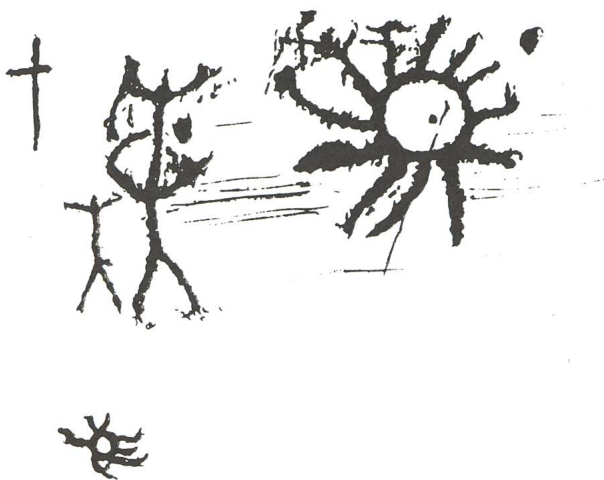
Abb. 7. Sonnenkorona von Capo di Ponte (Côren del Valento) Val Camonica Italien. Koordinaten: Geogr. Länge 10°21' östl. v.Gr., Breite 46°1' 40".

Eidgenössischen Sternwarte ist es bei der totalen Sonnenfinsternis vom 16. Febr. 1980 in Yellapur (Indien) gelungen, mit Hilfe eines Spezialfilters ein Koronabild der Sonne aufzunehmen, bei dem die Koronastrahlen bis zum 1 1/2 fachen Sonnendurchmesser sichtbar sind. Sonst ist das menschliche Auge in dieser Beziehung im Vorteil, da seine Empfindlichkeit sowohl feine Kontraste erkennen, wie auch grosse Helligkeitsunterschiede überbrücken kann.