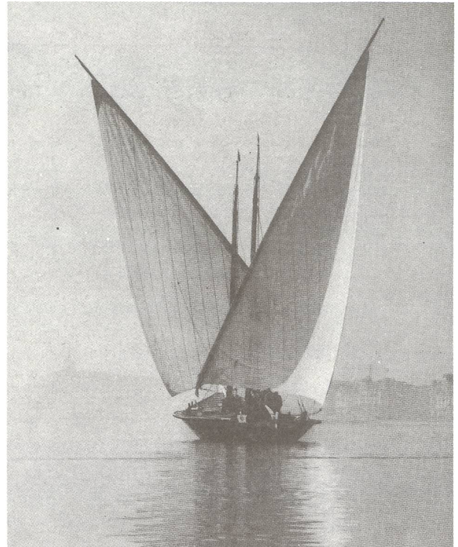
1971 erwarb die Stadt Genf die «Neptune» und liess sie restaurieren; 1976 wurde sie der Stiftung Neptune übergeben die sie verwaltet und unterhält.

Die «Neptune» war die letzte grosse Barke, die in der Schiffswerft von Locum (Frankreich) 1904 gebaut wurde. Sie war zum Materialtransport bestimmt: Steine von Meillerie und Kies von le Bouveret. Dank ihrer zwei Hauptsegel und dem Vorsegel erreichte die «Neptune» Genf in einer Zeit, die zwischen 6 und 12 Stunden schwankte; sie transportierte jedes Mal 120 Tonnen Material. Die Barke hat eine Länge von 27 m und ist heute mit zwei Motoren von je 80 PS ausgestattet.