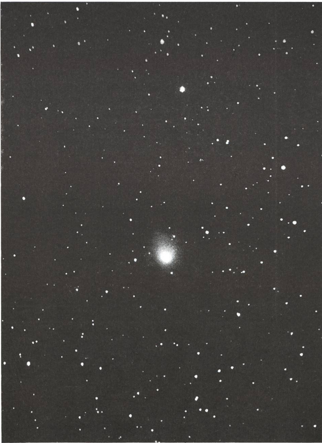
Komet Bradfield 1987s. 16. Januar 1988. 18.40-18.55 WZ. 150-mm-Newton, 1:5, Kodak T-MAX, aufgenommen in Utajärvi. 60 mm = 1°.