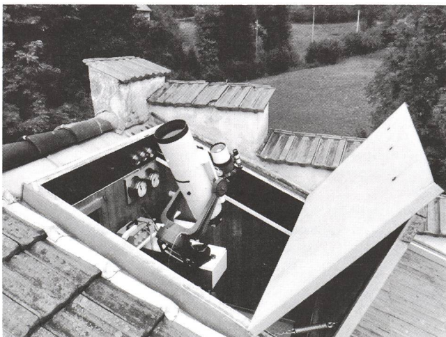
Abb. 2 Ansicht der Beobachtungsstation mit geöffnetem Faltdach

Vor Ungefähr 10 Jahren zog ich in das Haus «Sonnenbühl» in Weesen. Meine astronomische Ausrüstung bestand damals aus einem selbstgebauten Refraktor mit einem Achromaten von 600 mm Brennweite (Schweiz. Astro-Materialzentrale), später kam noch ein Celestron 8 Spiegelteleskop dazu.