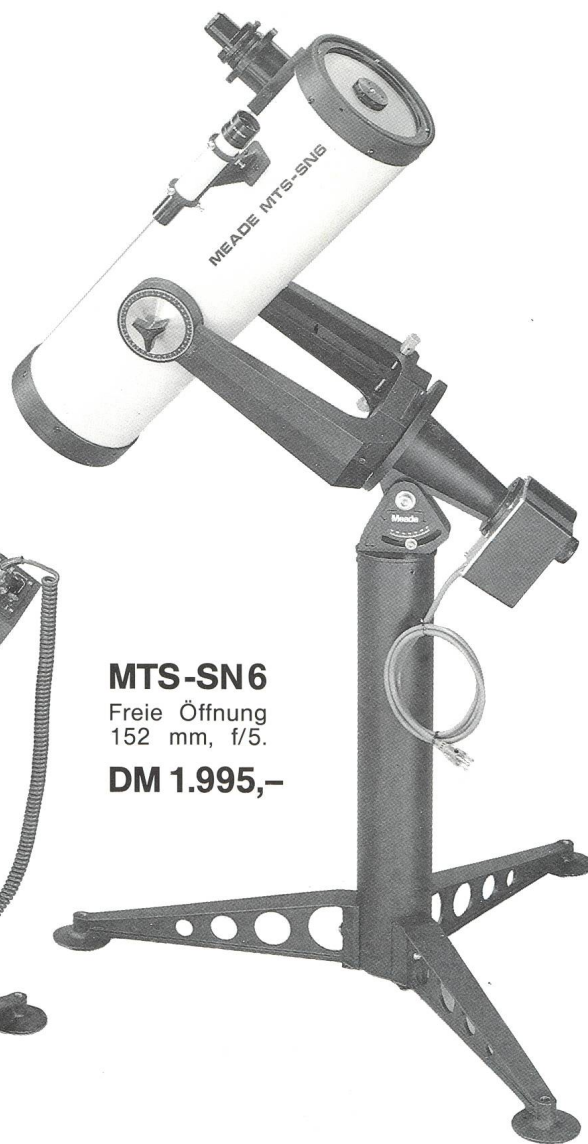
MTS-SN6 Freie Öffnung 152 mm, f/5 . DM 1.995,-