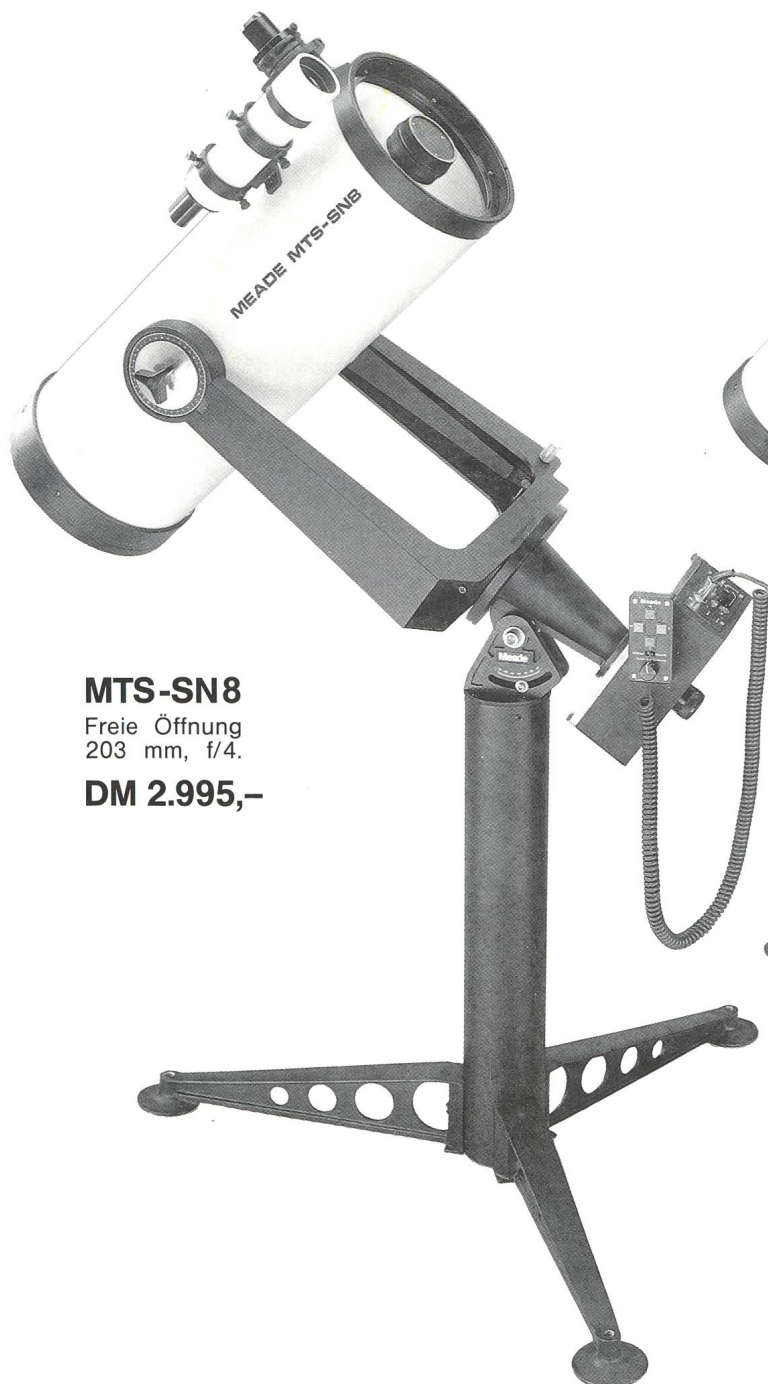
MTS-SN8 Freie Öffnung 203 mm, f/4 . DM 2.995,-

Die Grundausrüstung beider MTS-SN Modelle beinhaltet: Einen kompletten Tubus mit Spezial-Okularauszug; ein Okular Typ Kellner f = 25 mm; eine Gabelmontierung ohne Teilkreise, ohne Deklinations-Feineinstellung und ohne Nachführmotor; eine stabile Säule mit drei abnehmbaren Beinen und Skala für Polhöhe.