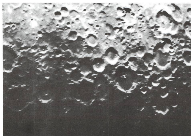
Luna - Duplicatore di focale - Esposizione 1"