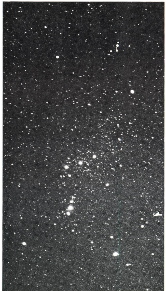
ORION. Kamera 1.8/50 mm - Film T-MAX P3200 - 20 sec. 9.2.89