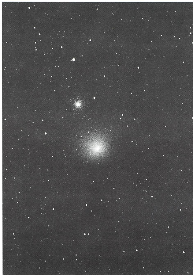
▲ Fig. 8. Photo de la comète Levy 1990c avec queue provoquée par le plasma solaire.

Date: 18 août 1990 à 1 h 48' MESZ; Exposition: 22 minutes; Film: TMax 3200 ISO professionnel; Appareil: Nikon F3; Instrument: Reflex-Nikkor F6/500mm sur Atlux; Temps: d'une clarté extraordinaire!