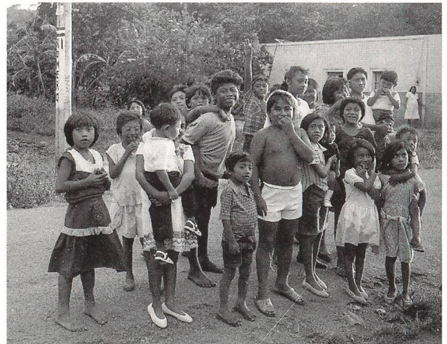
Abb. 5: Maya-Kinder in Yucatan

Zeremonie, und eine Mannschaft musste geopfert werden. Aber man weiss heute noch nicht, ob die Sieger oder die Verlierer geopfert wurden.