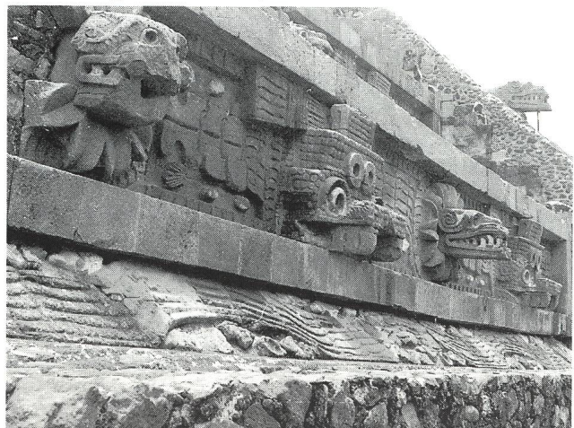
Abb. 3: Der Quetzalcoatl-Tempel in Teotihuacan

Unsere Reise führte uns dann über Guernavaca zur malerisch an einem Hügel liegenden Stadt Taxco, deren Kathedrale und Häuser im Kolonialstil gebaut waren. In Oaxaca, ziemlich im Süden des Landes, logierten wir in einem ehemaligen Nonnenkloster. Dort besuchten wir die von den Zapoteken errichtete Indio-Akropolis auf dem Monte Albán. Für die Mixteken, die Nachfolger der Zapoteken, wurde der Monte Albán eine Nekropolis. In einer Grabkammer hat ein mexikanischer Archäologe einen Grabschmuck gefunden, dessen Pracht und Reichtum den altägyptischen Funden kaum nachsteht. Dann ging es in die Tropen, ins Land der Mayas: Palenque, Uxmal, Kabáh und schliessliche Chichén Itzá. Die restlichen drei Tage verbrachten wir in der von den Amerikanern in den 70-er Jahren gebauten sterilen Retorten-Ferienstadt Cancún an der Karibik. Ueber diese Art Neo-Kolonialismus zu schreiben, auch über den überrienen Luxus unserer Fünfstern-Hotels im von Schulden und Armut geplagten Land, verbietet mir die Höflichkeit.