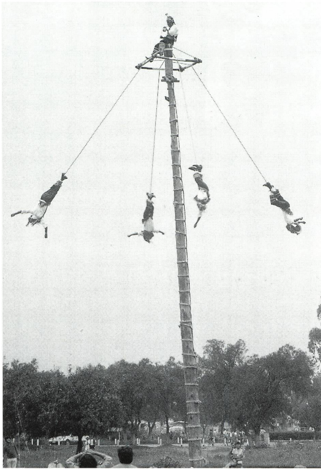
Abb. 2: 4 "voladores" mal 13 Umdrehungen = 52 Jahre

Trockenzeit! Von Kanalisation keine Rede, schon gar nicht von Lärmschutz. Nach etwa 30 km Fahrt durch eine recht fruchtbare Landschaft nordöstlich der Hauptstadt sahen wir vor einem kahlen Bergrücken die relativ flachen Silhouetten der Sonnen- und der Mondpyramide. Die Stadt Teotihuacán ist um 800 untergegangen, ihr Name bedeutet "der Ort, wo sich Menschen in Götter verwandeln". Vor der Besichtigung bot sich uns ein typisch mexikanisches Schauspiel, heute Touristen-Attraktion - früher vermutlich ein Fruchtbarkeitskult zu Ehren des Gottes Xipe Totec: Fünf Indios in farbenprächtiger Tracht sassen auf einer kleinen Plattform in schwindelerregender Höhe. Wie sie die 20 m hohe, recht dünne Stange emporgeklettert waren, haben wir nicht gesehen. Der mittlere erhob sich und spielte auf seiner Flöte eine ekstatische Melodie. Dabei tanzte er stampfend. Plötzlich liessen sich die anderen vier kopfvoran in alle vier Himmelsrichtungen fallen. Sie wurden aber von einem Seil, das um ihre Waden geschlungen war, gehalten. Das Quartett begann sich zu drehen wie ein Karussell, und mit jeder Umdrehung wurden die Seile länger. Nach 13 Umdrehungen erreichten die vier waghalsigen Akrobaten den Boden. 13 Umdrehungen mal 4 "voladores", so heissen die Turmflieger, sind 52 Jahre. Diese Rechnung ist physikalisch vielleicht anfechtbar, aber das ist ein Hauptzyklus im aztekischen Kalender. Diese geheimnisvollen 52 Jahre haben einige von