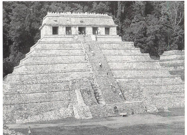
Abb. 4: Der Tempel der Inschriften in Palenque

Zeugnisse von Menschenopfern sahen wir auch in Chichén Itzá: Ein Relief am Ballspielplatz zeigt zuunterst den Sonnengott als Totenkopf, der nach Blut dürstet. Die Indios der vorkolumbischen Zeit waren nämlich stets in Sorge, dass die Sonne am nächsten Morgen nicht mehr aufgehe. Links vom Sonnengott sieht man einen Ballspieler in voller Montur mit einem Obsidianmesser. Rechts steht ein Ballspieler ohne Kopf. Aus seinem Hals spritzt Blut, und die Blutstrahlen haben Schlangenköpfe. Das Ballspiel war eine religiöse