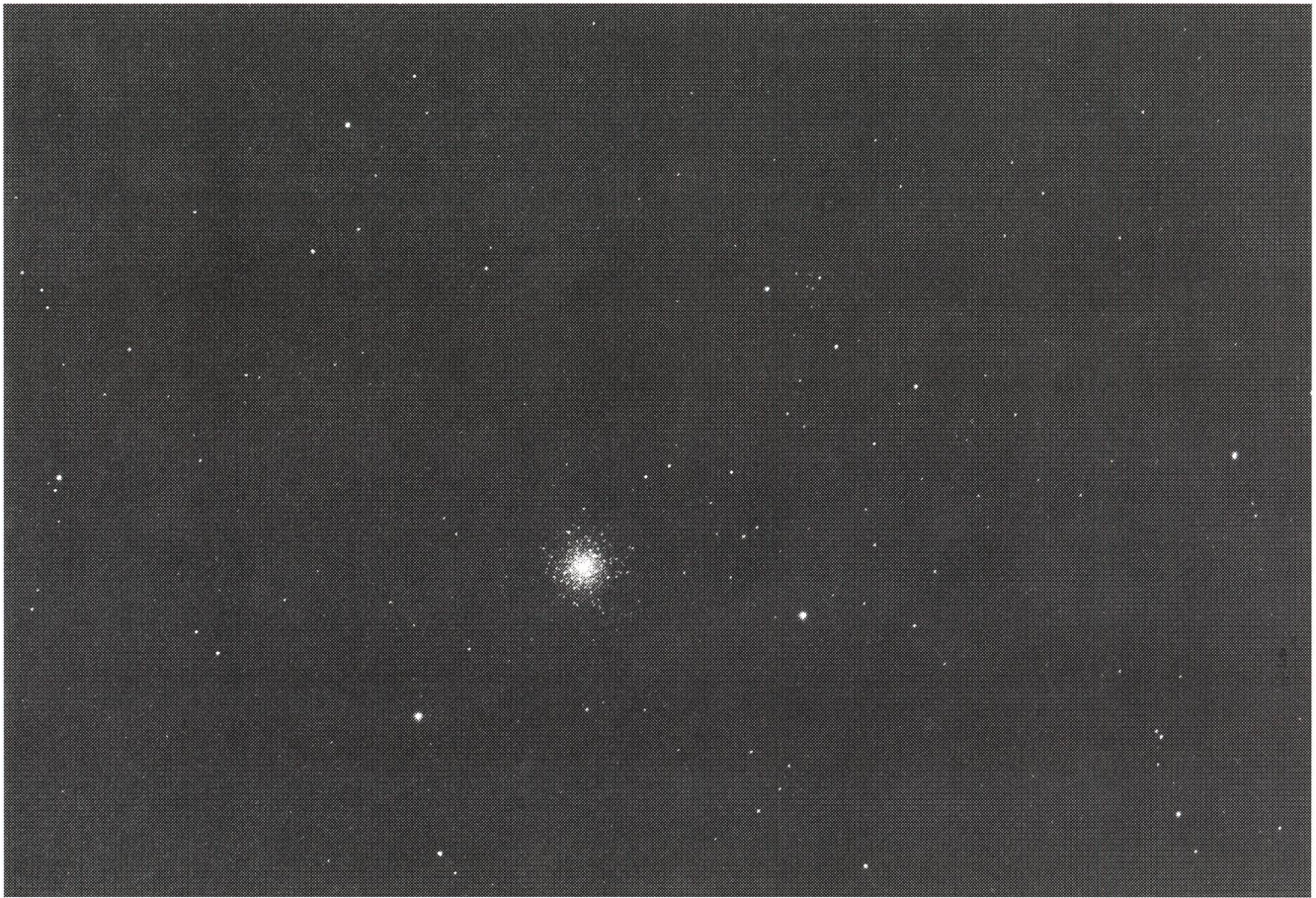
Amas globulaire M13, Mercurius; T254/1145, 18 min. sur Ektar 1000. 30.7.92, 2230 HEC

cliché, mais cruellement évidents à l'oculaire de guidage où un grossissement élevé est de règle. On n'obtient jamais une image d'étoile bien « piquée », et ce fait exclut des astres très faibles. Il y a donc avantage à pouvoir explorer une plage de ciel d'une certaine largeur pour trouver la bonne étoile ; cela facilite également le cadrage du cliché. Autant d'arguments qui prèchent pour un correcteur de champ au diamètre optique dépassant un peu les 42 - 46 mm des modèles du commerce.