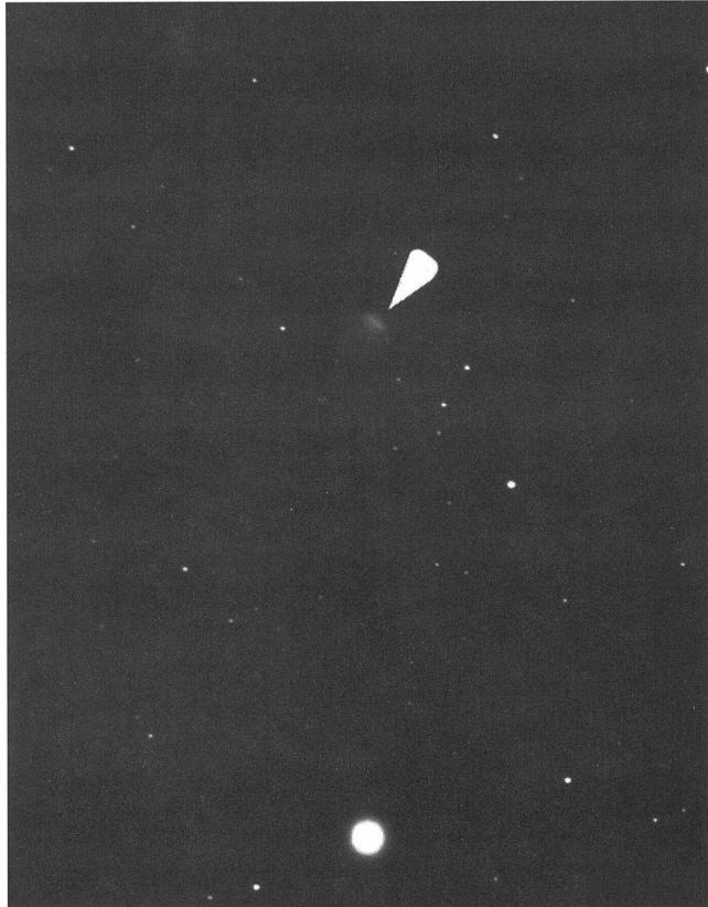
▲ P/Schaumasse; 17.1.92; FFC 500/3.5; Tmax 400; 7 min.; J.G. Bosch