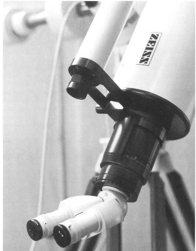
Figur 3: Das hintere Ende des Tubus mit dem Fokussiertubus sowie dem Zeiss-Binokularansatz und dem verstellbaren Sucher.

Beobachter schwebte in einem Raumschiff über der Mondoberfläche. Das Einstellen des Binokulars geht allerdings nicht ohne zusätzlichen Zeitaufwand, was besonders bei grösseren Besuchergruppen ins Gewicht fällt: der Kopf muss in die richtige Position gebracht werden, Fokus und Augenabstand müssen individuell eingestellt werden.