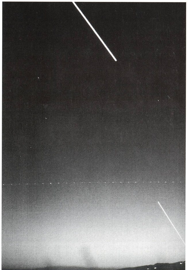
Venus und Merkur