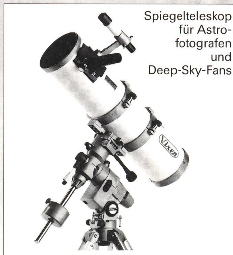
Spiegelteleskop für Astro- fotografen und Deep-Sky-Fans