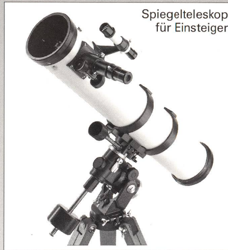
Spiegelteleskop für Einsteiger