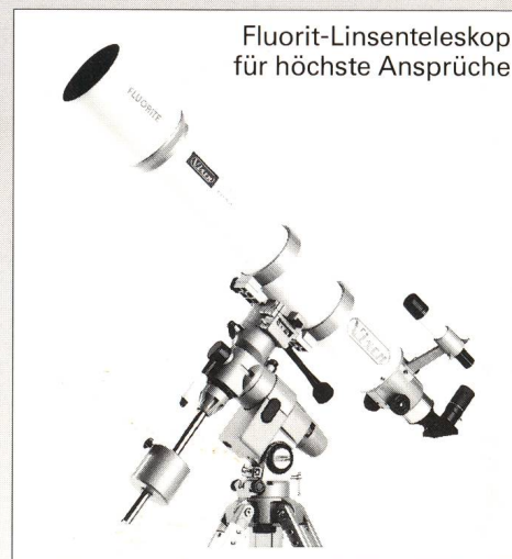
Fluorit-Linsenteleskop für höchste Ansprüche