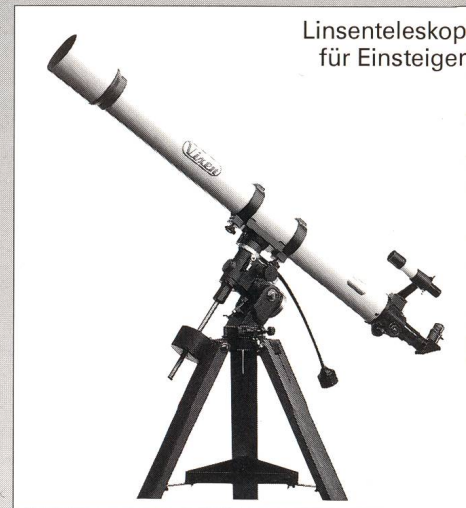
Linsenteleskop für Einsteiger