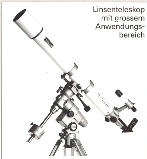
Linsenteleskop mit grossem Anwendungsbereich