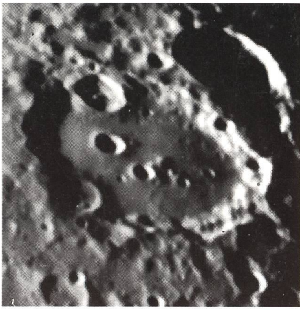
Mondkrater Clavius, fotografiert mit Vixen FL-80 S

Die Vixen-Erfolgsformel für Freude an der Astronomie