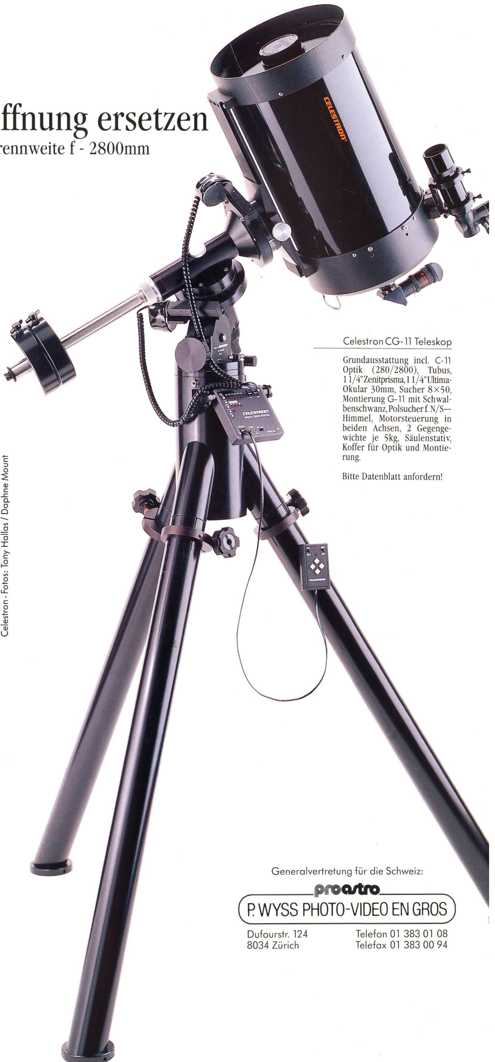
Celestron CG-11 Teleskop

Grundausrüstung incl. C-11 Optik (280/2800), Tubus, 1 1/4" Zenitprisma, 1 1/4" Ultima-Okular 30mm, Sucher 8x50, Montierung G-11 mit Schwalbenschwanz, Polsucher f.N/S-Himmel, Motorsteuerung in beiden Achsen, 2 Gegengewichte je 5kg, Säulenstativ, Koffer für Optik und Montierung.