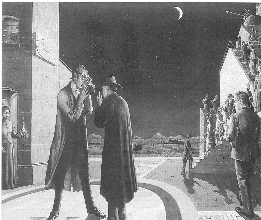
«Les phases de la Lune III» (1942), huile sur toile (155x175) au Museum Boymans-van Beuningen de Rotterdam, aussi exposée à Bruxelles dans le cadre de la rétrospective.

«Les phases de la Lune III» (1942) ont notre préférence «astronomique». Au premier plan, Lidenbrock dans sa position coutumière et un autre personnage examinent une roche. Sur la gauche, la base d'une tour carrée supporte un cadran solaire et abrite à l'étage un mécanisme expliquant ces phases de la Lune. Une femme, lampe de pétrole à la main, est sur le seuil de cette tour. La partie droite est à la fois plus peuplée et plus «industrielle». Une procession de personnages montent et descendent un escalier en plusieurs niveaux conduisant à un observatoire (coupole, lunettes, mécanismes, ...). Derrière se trouve un autre bâtiment surmonté de cheminées d'usine. Le fond du décor est un paysage quasi-désertique (avec néanmoins ces lampadaires et vieilles locomotives chers à Delvaux). Le ciel, d'une superbe limpidité, est abondamment étoilé et offre une reproduction quasi-photographique d'une Lune proche de son premier quartier. Cette toile évoque inévitablement le décor nocturne des grands observatoires modernes (désert, montagnes lointaines, pureté du ciel, etc.). Notons aussi qu'ex-