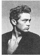
James Dean (1931-1955)

À la sortie d'une séance de planétarium, une bande de jeunes turbulents et une égérie fugueuse provoquent un nouveau venu dans leur quartier. L'affrontement sur la terrasse de l'édifice dégénère en une bagarre au couteau à laquelle il est heureusement mis fin par un des gardiens du site.