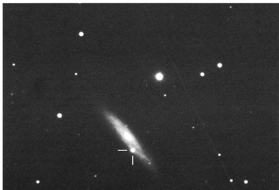
SN 1998 S